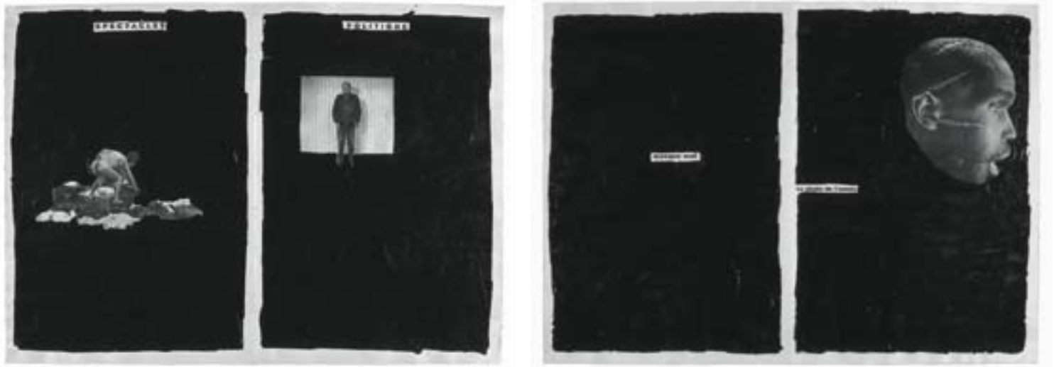
Des pages de Libération mises au noir par Frédéric Druot : une série de mille «vis-à-vis» dénommée La nuit, je mens qui désorganise les fausses vérités et réorganise les vrais mensonges des pages périssables d'un quotidien pour ne jamais les perdre et les transformer en papiers peints.