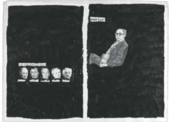
Pages of the daily paper Libération have been blackened by Frédéric Druot : a series of 1.000 pages « vis-à-vis », called La nuit, je mens which disrupts false truth and reorganizes true lies of perishable pages of a daily paper in order to never lose them or transform them into wallpapers.